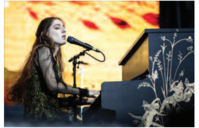
A brit Birdy énekesnő koncertje a Hajógyári-szigeten a 25. Sziget fesztivál utolsó napján.

A főszervező emlékeztetett arra, hogy az 1993-as induláskor és utána is jó néhány